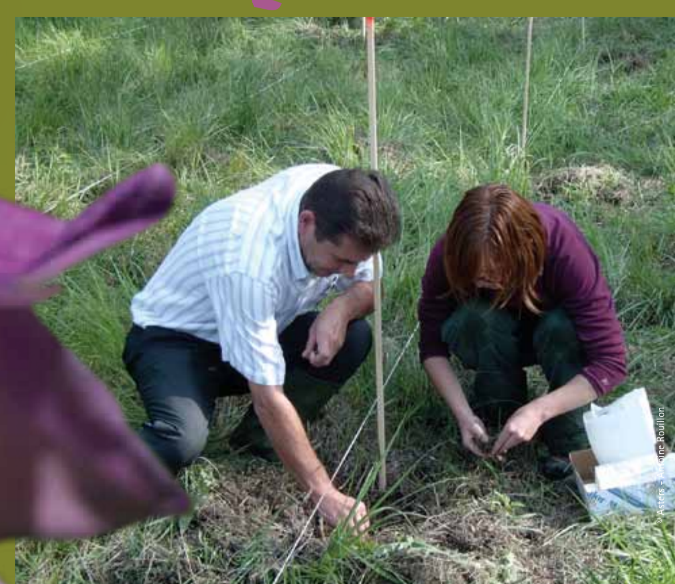
Réintroduction des bulbes

A l'inverse, les activités humaines peuvent conduire à la destruction du Glaïeul des marais : plantations forestières, urbanisation, enrichissement du sol ou remblaiement des zones humides.