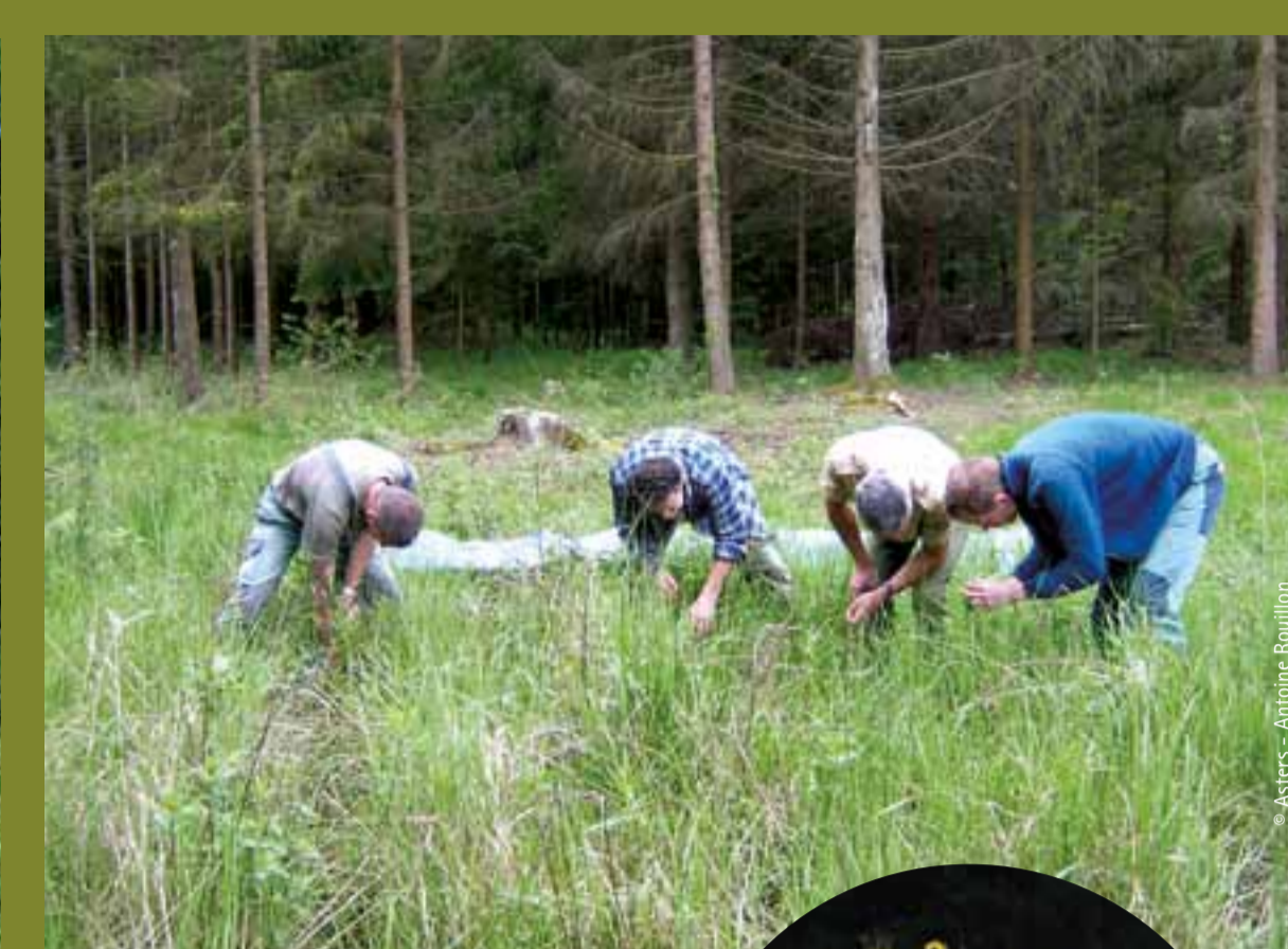
Arrachage du solidage