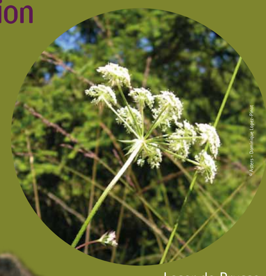
Laser de Prusse