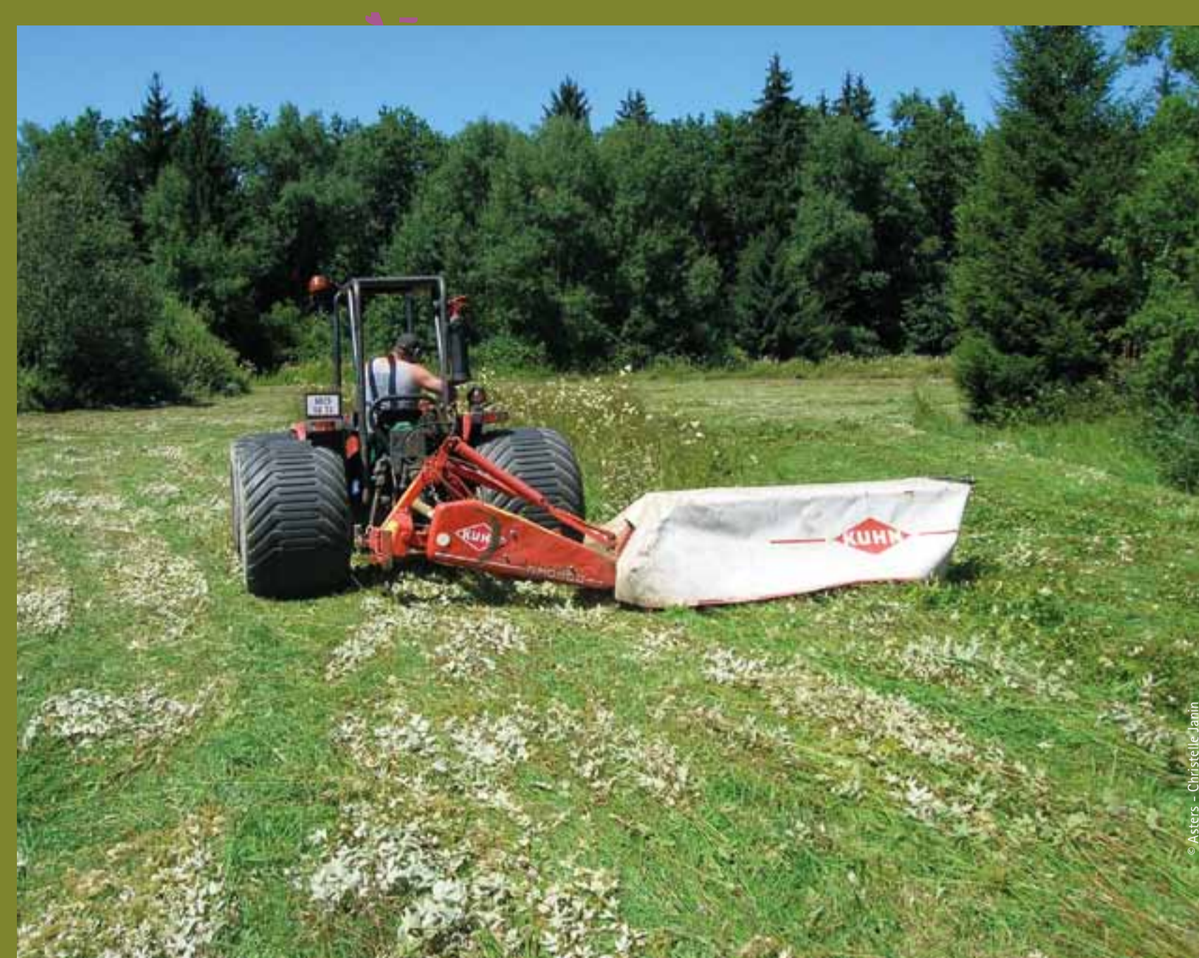
Fauche avec engin spécialisé